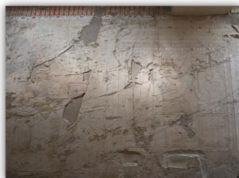
Ramose bénéficiant d'une audience auprès d'Amenhotep IV, tombe TT 55.

Doctorante en égyptologie. Université Paul Valéry Montpellier III