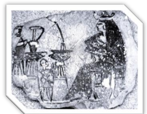
Nourrice allaitante. Ostracon du Louvre E.27661