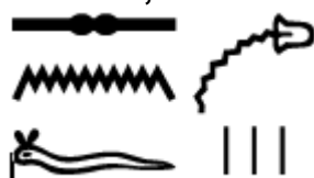
Sénéfou « sang » en hiéroglyphes