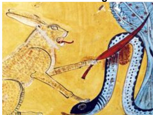
Relief de la tombe d'Inerkhaouy, 20 e dynastie, Deir el Medineh. D'après Cherpion (N.) et Corteggiani (J.P.), La tombe d'Inerkhaouy (TT 359) à Deir el Medina, MIFAO 128/2, 20102010, pl. 98.

Cette conférence se propose d'étudier les représentations et les fonctions du sang en Égypte ancienne à travers le prisme de la langue. En effet, pour comprendre comment les anciens Égyptiens imaginaient ce précieux liquide, il est essentiel de définir les multiples entités linguistiques qui s'y rapportent. Le discours se focalisera d'abord sur le mot sénéfou qui est le plus fréquemment employé. Il peut désigner un sang répandu ou non, le sang de l'homme, de la femme, de l'animal ou encore de la divinité. Toutefois, l'égyptien utilise une terminologie très variée pour parler du sang. Plusieurs lexèmes issus du monde des couleurs sont utilisés, tels que le rouge- déchérou , l'ocre sanguine tjérou ou encore les tissus rouges jnsu . Ces mots revêtent un caractère ambivalent : effrayants lorsqu'ils sont associés à la violence des dieux, ils se parent d'aspects plus positifs quand ils évoquent le soleil ou la maternité. Certains saignements spécifiques peuvent aussi recevoir un vocabulaire propre ; c'est le cas par exemple des menstruations qui sont appelées hésémen , terme qui peut aussi se traduire « purification ». Enfin, quelques métaphores d'ordre hydrographique seront également discutées. En effet, l'égyptien décrit souvent le sang comme un « fleuve », un « marais » ou une « inondation ».