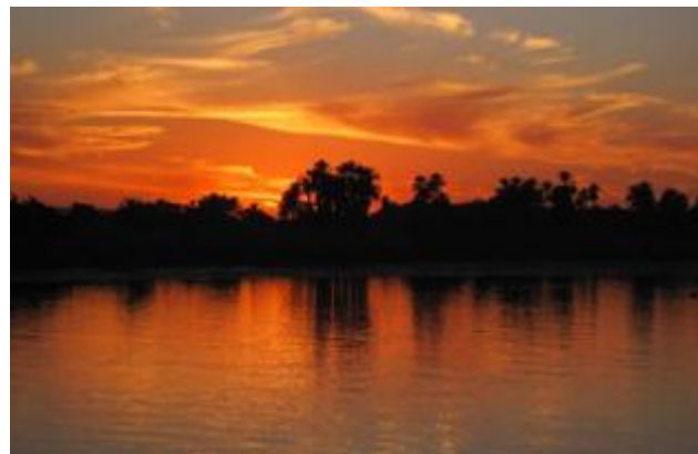
Couleur du ciel et couleur du fleuve au crépuscule, Louxor