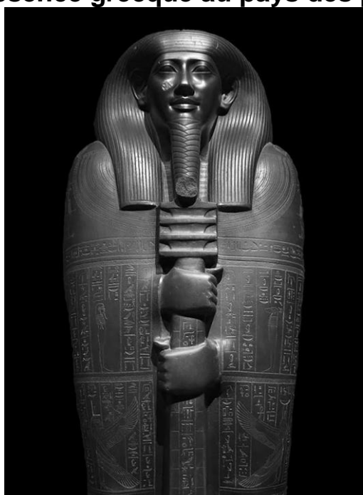
Sarcophage d'Ibi, Turin cat. 2202.

C'est par le biais de l'autobiographie, genre majeur qui traverse l'ensemble de l'histoire pharaonique, depuis l'Ancien Empire jusqu'à l'époque ptolémaïque, que le défunt s'adressait aux générations futures pour leur transmettre son expérience de vie, souvent idéalisée, mais aussi pour leur promettre soutien et protection depuis l'au-delà. Il attendait en retour l'accomplissement du culte funéraire et la perpétuation du souvenir de son nom. Les périodes tardives ont livré quelques autobiographies remarquables, injustement méconnues, qui reflètent parfois de manière à la fois savante et originale la mixité culturelle consécutive à la présence grecque au pays des pharaons.