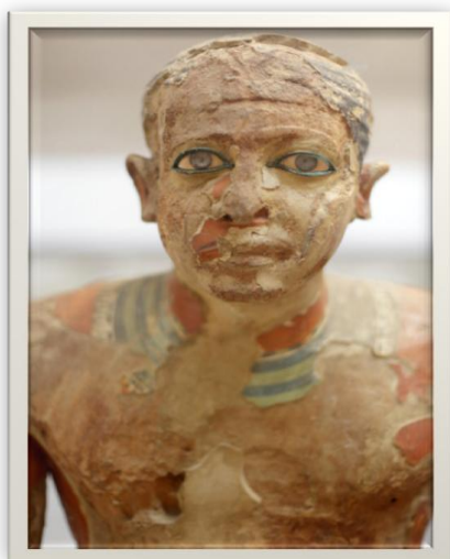
Statue de Mitéri, Caire JE 93165

L'Égypte des pharaons n'a pas seulement légué des monuments spectaculaires comme les pyramides, les temples de Karnak ou les hypogées de la Vallée des Rois. Cette civilisation plurimillénaire nous a aussi transmis des œuvres littéraires d'une qualité parfois remarquable. On prendra garde, toutefois, de ne pas aborder ces œuvres sous le seul angle de l'esthétique. Le « beau », dans la culture pharaonique, est en effet indissociable des notions d'achèvement, d'efficacité et d'utilité. La perfection formelle, dans le domaine littéraire comme dans ceux de l'iconographie ou de la statuaire, est toujours au service de la performance, c'est-à-dire d'un souci de rendre plus efficace encore le message délivré. On proposera un florilège de quelques-unes de ces multiples pépites de l'esprit, issu d'une anthologie de la Littérature de l'Égypte ancienne , actuellement en cours de publication.