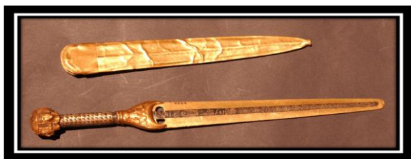
Dague d'Âhmosis (Caire JE 4666)