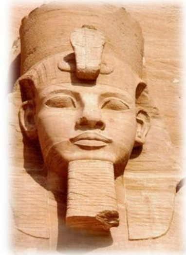
Colosse de Ramsès II (Abou Simbel)