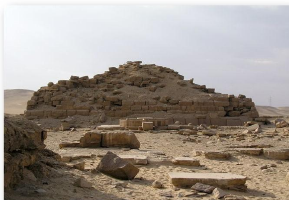
Temple solaire de Nyouserrê